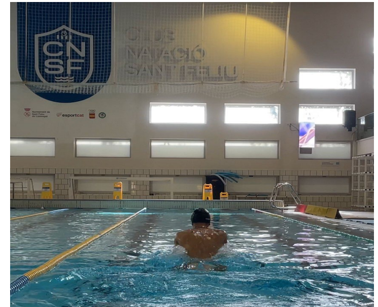
comprovant la hipòtesi n.3

Les conclusions mostren que millorar la tècnica, adaptar els subaquàtics i controlar el clor pot marcar una important millora en els resultats de les competicions.